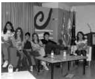
Jóvenes en Zaragoza

La huelga general fue seguida de manera desigual en el municipio. Con antelación un grupo de personas crearon una comisión de apoyo y se organizaron para realizar diferentes actos ese día. Casi cien personas se manifestaron en una concentración que discurrió por las principales arterias de la capital de Sobrarbe, Aínsa. Todo ello de forma pacífica. En la Plaza Mayor leyeron un manifiesto en contra de la reforma laboral.