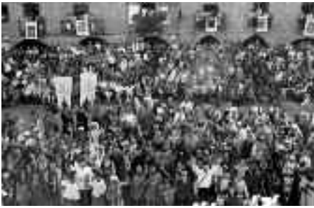
La Morisma 2010

La Asociación Cultural La Morisma presentó a Aínsa a Mi pueblo es el mejor , un concurso del Heraldo pero no obtuvo el apoyo necesari-