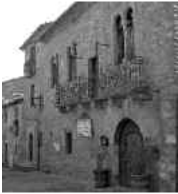
Fachada del Museo, Casa Latorre

Durante este tiempo también se ha promocionado el Museo de Artes y Oficios de titularidad privada y gestionado desde hace unos años por el Ayuntamiento. Se prepararon actividades para un fin de semana que consistían en mostrar in situ algunos trabajos tradicion-