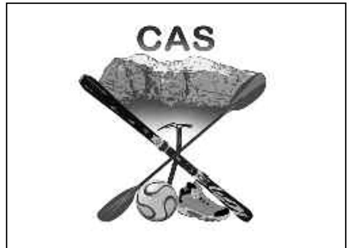
Nuevo logo del CAS

zo y dedicación por parte de quienes lo gestionan.