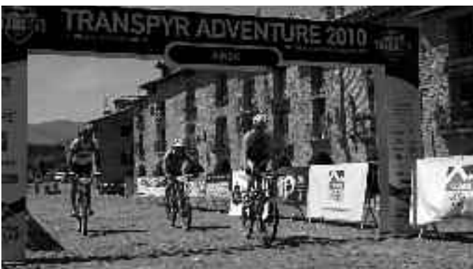
Participantes en la Transpyr de este año

En junio también llegó y de Aínsa partió la Transpyr , que es el gran reto de los Pirineos al ser cruzados en BTT. Una aventura por etapas que unió el mar Mediterráneo con el océano Atlántico a lo largo de la vertiente sur de los Pirineos, atravesando y uniendo Catalunya, Aragón, Navarra y Euskadi.