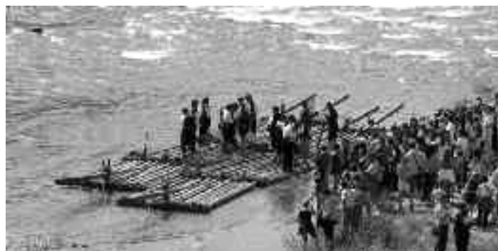
Descenso de Nabatas por el Cinca

Dos nabatas surcaron las aguas del río Cinca en el tradicional descenso anual. Este acto se convierte cada año en un homenaje y una fiesta. Desde Laspuña a Aínsa. Mucho público acudió a presenciar el recorrido.