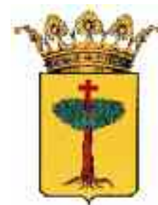
Ayuntamiento de Aínsa-Sobrarbe