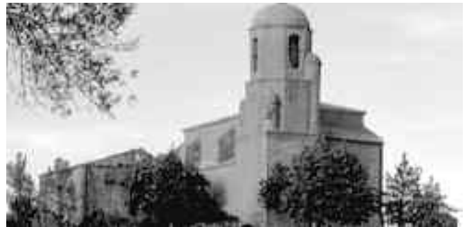
Iglesia de Olsón

Una nueva cámara nos mostrará imágenes fijas de Aínsa , el cruce y el puente sobre el Ara. Dicha cámara