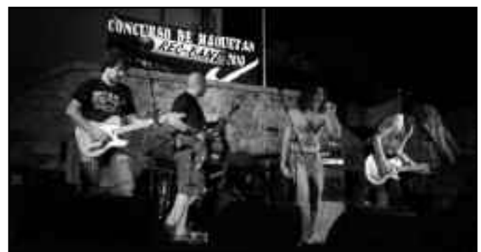
Actuación de Trifulca en las Eras Altas.

Arrock organizó la primera edición del certamen de maquetas “REC-BAND” de la que salieron vencedores el grupo malagueño Trifulca. Noventa y dos bandas se inscribieron. La asociación ha contado con la colaboración de dos ayuntamientos, el de Boltaña y el de Aínsa-Sobrarbe. El ganador toca en el Festival Castillo de Aínsa y graba un disco en Labuerda.