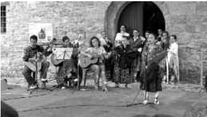
Audiciones de la Escuela de Música

A finales de junio se celebraron las ya clásicas audiciones de música de la escuela municipal . El escenario elegido fue la Plaza Mayor y la verdad es que el tiempo no acompañó y por ello se eligió este lugar, al disponer del escenario con carpa. El último día el Dúo pianístico Tena Manrique realizaron un concierto, dentro del circuito cultural. El resto de audiciones fueron de las disciplinas que se han impartido en la escuela, desde jota a instrumentos tradicionales, pasando incluso por una charanga.