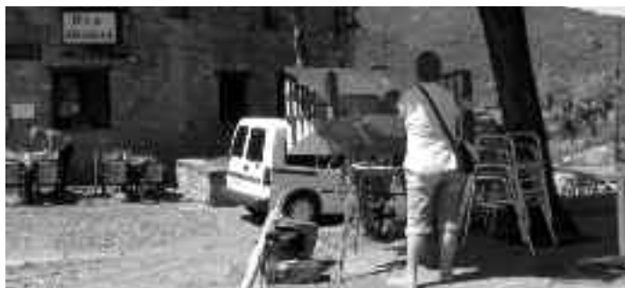
Uno de los participantes del concurso