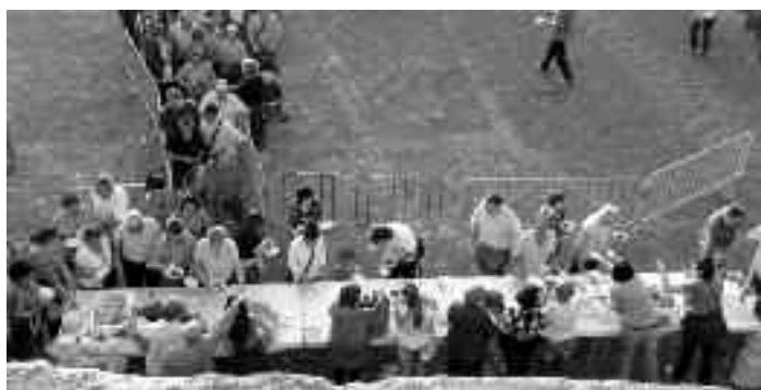
Fiesta de los Palacios 2010

Con la colaboración de la Asociación Villa de Aínsa, se realizó la fiesta de Los Palacios , también colaboraron La Asociación de Mujeres el ECO. Se realizaron los actos tradicionales, romería, el cordero asado y vino. Por la tarde el Biello Sobrarbe bailó como suele ser ya tradicional. Con la caracolada y la música de la orquesta Sobrarbe finalizó la fiesta.