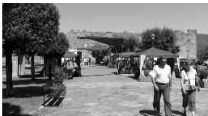
Mercado del castillo

Durante los fines de semana del mes de julio se está realizando un mercadillo medieval . Si va funcionando bien continuará en agosto. Esta situado en el paseo del castillo.