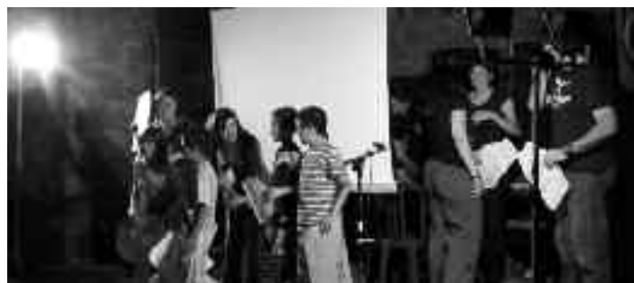
Actividades de la EVA

Los organizadores de la EVA eligieron un año más Aínsa para realizar sus jornadas formativas. La Escuela de Verano del Alto Aragón. Trajeron casi una semana de cursos y seminarios. El colofón de éstos se realizó en el Jardín de Museo con actividades abiertas al público en general. Cerca de 90 educadores se inscribieron.