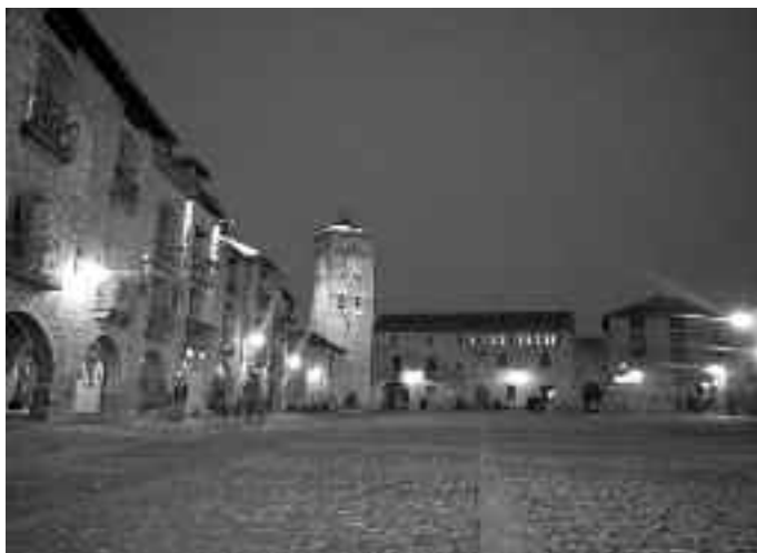
Casco antiguo de Ainsa

El Centro para el Desarrollo de Sobrarbe y Ribagorza (CEDESOR), dentro de su actual programa de ayudas ha concedido una a nuestro ayuntamiento para el proyecto de Accesibilidad y Seguridad en el Casco Antiguo de Ainsa. El proyecto consiste en la realización de un perímetro enlosado en el patio del Castillo de forma que se facilite el tránsito tanto de personas discapacitadas como de carros de niños desde el aparcamiento hasta la plaza. Por otra parte contempla la ejecución de barandillas protectoras sobre el muro que da a la carretera de acceso a la plaza (zona del jardín) así como la instalación de pasamanos en el acceso conocido como la Costera entre los barrios bajo y alto, que faciliten el tránsito de personas mayores especialmente. El montante de la ayuda asciende a 100.000 €.