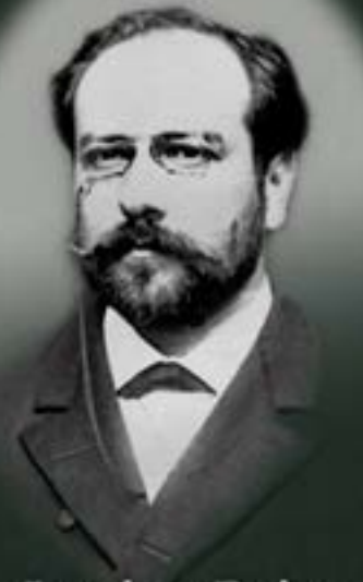
Lucien Briet (París, 1860 - Charly, 1921)

VOTACIÓN DEL PREMIO DEL PÚBLICO: Durante toda la exposición en la urna situada en la oficina de turismo comarcal.